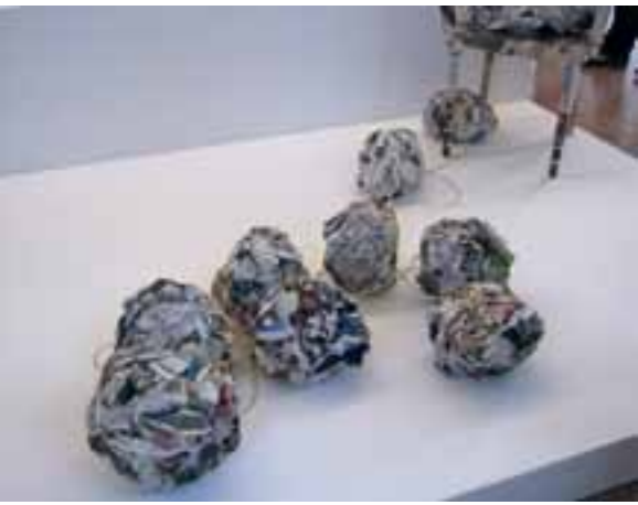
Impressionen der Ausstellung

Neue Mitglieder – Skulptur, Plastik Objekt, BBK-Galerie im Abraxas, Augsburg, 25.09. – 23.10.2011