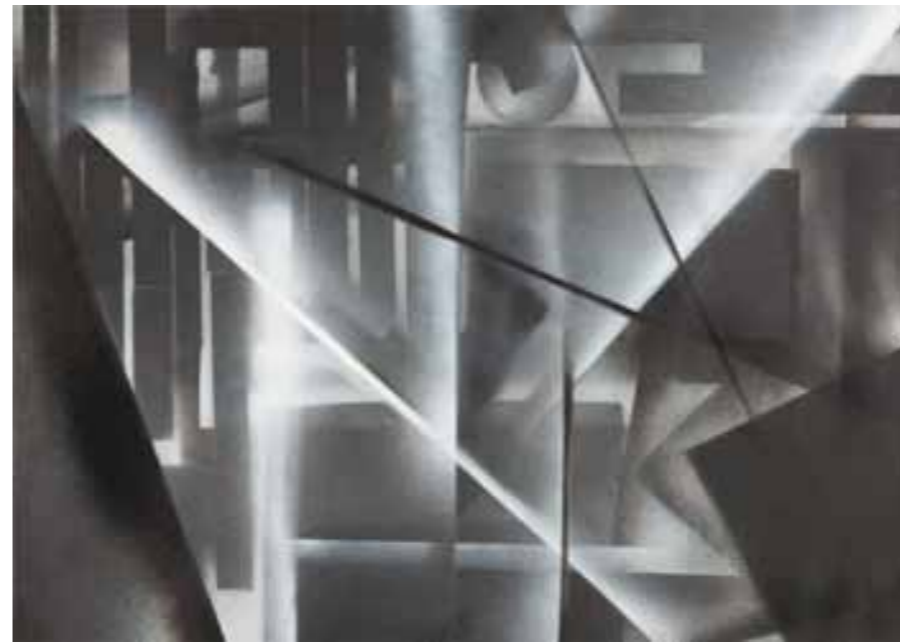
Christa Oldenburg „o. T.“, Acryl-Mischtechnik, 50 x 70 cm