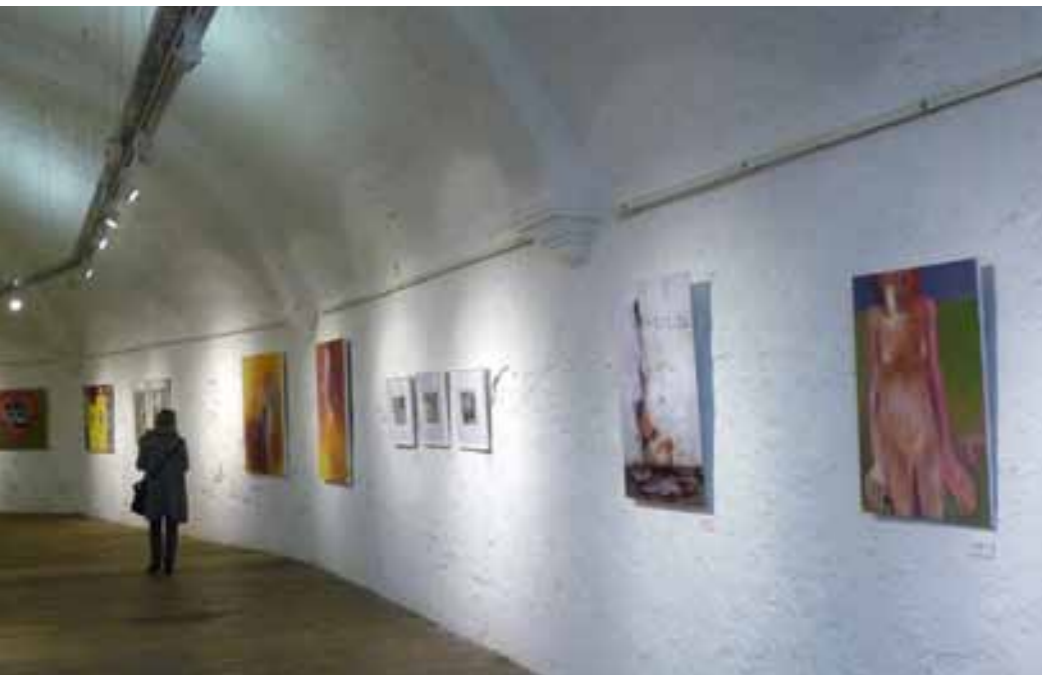
Der BBK Unterfranken zu Gast in Ingolstadt: oben ein Blick in die Ausstellung, unten Walter Bausenwein „o.T.“