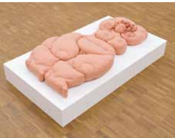
Erika Einhellinger „Sanfte Landschaft“, 2010