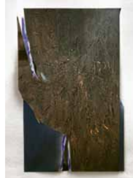
oben: Anke Völk „o.T.“, 2010, Acryl, Aluminium, versch. Papiere, vierteilig, 198x120x23cm, Foto: Roman März rechts: Michael Hackel/Emanuel Wadé „1001 Nacht“, Glas, Holz, Tesafilm, Foto © Emanuel Wadé