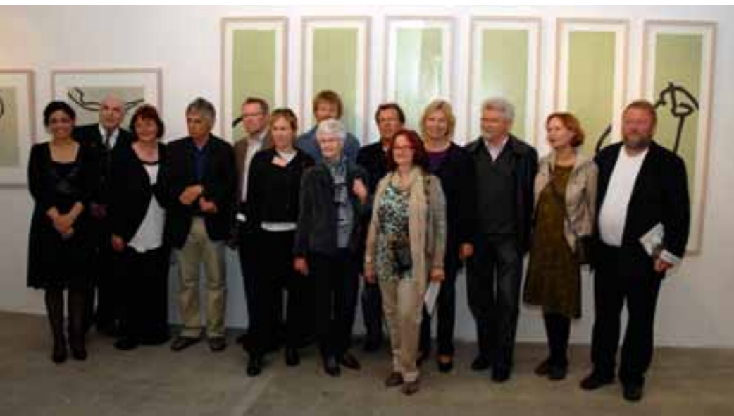
Bei der Eröffnung.