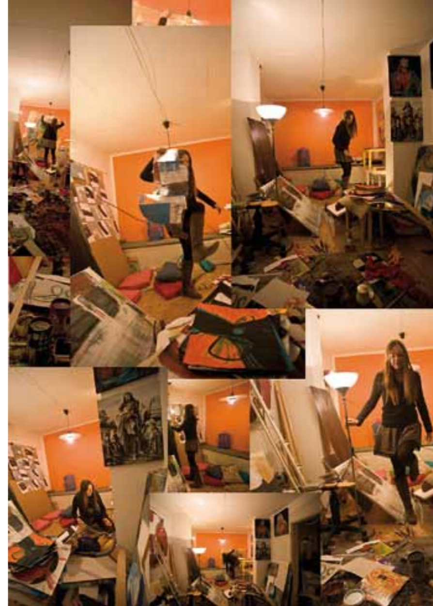
Im knietiefen, nassen Laub: Thomas Rau „Frischwassergrenze“, Fotoinstallation (Ausschnitt), 3 x 2 x 2 m, 2011

Anjalie Chaubal Geschäftsführerin art:phalanx Regensburg