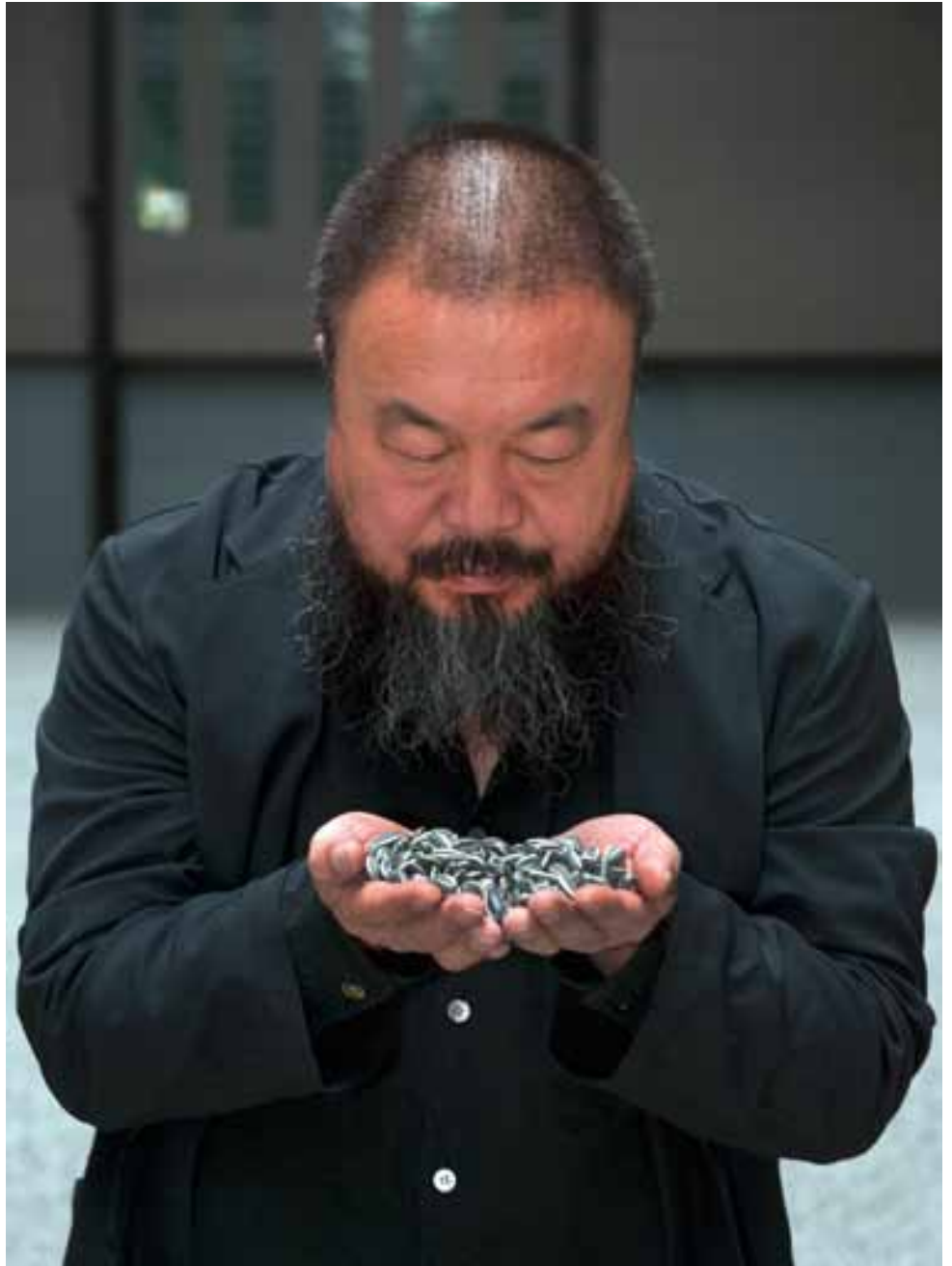
Ai Wei Wei mit „Sunflower Seeds“, 2010

Auch die großen Geldabzocker-Firmen und Banken, die sich in China weiterhin bereichern wollen, sowie die Architekten, die sich in China ihre Denkmäler setzen und zu guter Letzt die großen Galerien, die mit Ai Weiwei im Programm schon viel Kohle gemacht haben – alle vertreten das fadenscheinige Argument, die Verhaftung sei ein politischer Akt und habe mit Kunst nichts zu tun. Hier mischt man sich nicht ein.